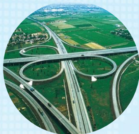
京台(福)、青银高速环绕 德上高速穿境