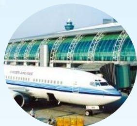
距济南机场 约1小时车程