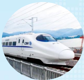
距京沪高铁东站 约30分钟车程

以德州主城区、武城同城发展为依托，以“两区一园”为载体，分别打造成承接京津冀产业转移的主阵地，对接德州、同城发展、融入京津冀的桥头堡和承接京津地区产业转移的创业基地和科技孵化基地。