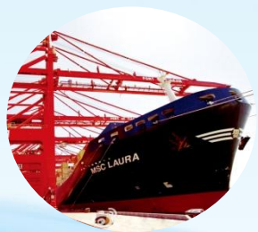
距青岛港约4小时车程 距天津港约2小时车程